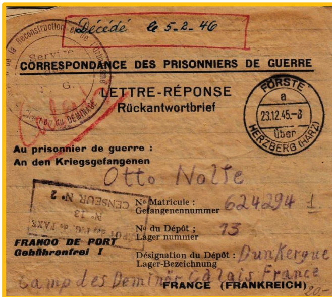
Abbildung 1: Kriegsgefangenenbrief nach Frankreich

Das alles galt nicht nur für Post aus der britischen Besatzungszone, sondern auch für Sendungen aus anderen Zonen in Lager in Großbritannien oder in britischer Verwaltung. Diese Sendungen mussten über die britische Militärverwaltung geleitet werden. Das Porto für Sendungen in im Ausland gelegene Kriegsgefangenenlager entsprach dem Auslandsporto für Postkarten und Briefe vor dem Krieg. Entsprechende Belege sind beliebte Sammelobjekte und es kommt häufig vor, dass vorgedruckte Rückantwortkarten oder -faltbriefe mit dem Vermerk „Gebührenfrei“ einen reizvollen Kontrast zu einer gleichwohl erfolgten Freimachung zeigen. Neulich fiel mir aber ein Kriegsgefangenenfaltbrief aus Förste über Herzberg (Harz) in ein französisches Lager in die Hände, den die Mutter des Gefangenen am 25.12.1945 geschrieben hatte. Sie bezog sich auf die Benachrichtigung über den Verbleib des Gefangenen vom 3.11.1945 und verwendete dafür den offiziellen Rückbrief-Faltumschlag, der am 28.12.1945 ohne Freimachung abgefertigt und befördert wurde (Abb. 1):