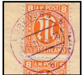
→ Abbildung 8 (17.11.1945)