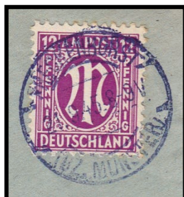
Abbildung 5 (... 46)