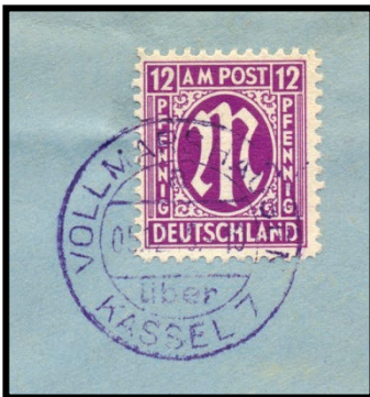
← Abbildung 7 (15.12.1945)

Blau mit wenig violett war die Stempelfarbe in Vollmarshausen über Kassel 7 (Abb. 7), während sich der Stempel in Würzburg 5 wohl nicht so recht entscheiden konnte - er hatte von allem ein bisschen (Abb. 8):