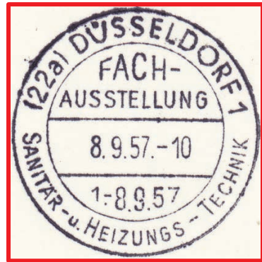
Abb.: www.stempeldatenbank.de )