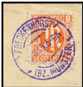
Abbildung 3 (10.8.1945)

Tief blauviolett und später dunkelblau wurde im August/September 1945 in Freckenhorst (Bz Münster) gestempelt (Abb. 3,4):