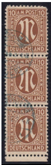
Abbildung 4 (21.9.1945)