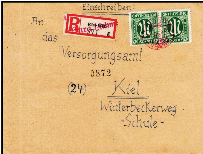
Abbildung 10: Einschreiben-Fernbrief nach Kiel (3.5.1946)

Stempelfarben. Das stempelte gelegentlich in Gebühr-bezahlt-Stempeln),