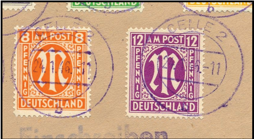
Abbildung 1: Ausschnitt aus einem echt nach Leipzig gelaufenen Einschreiben-Fernbrief (24.1.1946)

schwarz ausfallen und die Beimischung von Blautönen ist nicht selten. Allerdings gibt es auch Postämter, die das Tagesstempelgerät regelmäßig mit abweichender Farbe versahen. Das ist aber relativ selten. Vor einigen Jahren gab es eine Diskussion mit dem damaligen Verbandsprüfer wegen des Stempels Celle 2 b, der Anfang 1946 in klarem violett abgeschlagen ist und inzwischen als korrekt anerkannt ist (Abb. 1):